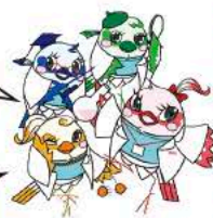
IRISオリジナルキャラクターです。

《場 所》 モアいずみ研修室 (和泉シティプラザ北棟4階) 《対 象》 小学生(1年生から3年生) と保護者 《定 員》 10組 20人 (1組大人1人につき、子ども2人まで) 《材料費》 300円 (保険代を含む) 《申 込》 11月11日(月) から定員に達するまで電話・FAX・WEBにて受付